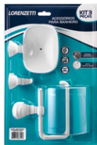
2003 F22 KIT COMPOSTO POR 3 PEÇAS (2009F22, 2020F22 E 2060F22) BRANCO