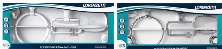
2000 F22 KIT COMPOSTO POR 5 PEÇAS (2009F22, 2020F22, 2040F22, 2049F22 E 2060F22) BRANCO | CROMADO