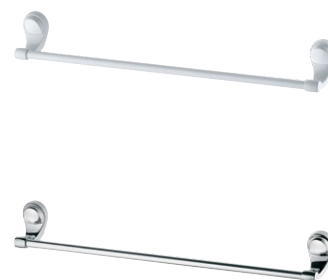
2040 F22 TOALHEIRO BARRA BRANCO | CROMADO