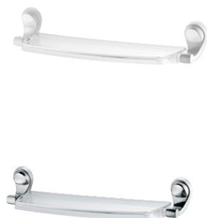
2028 F22 PORTA-SHAMPOO BRANCO | CROMADO