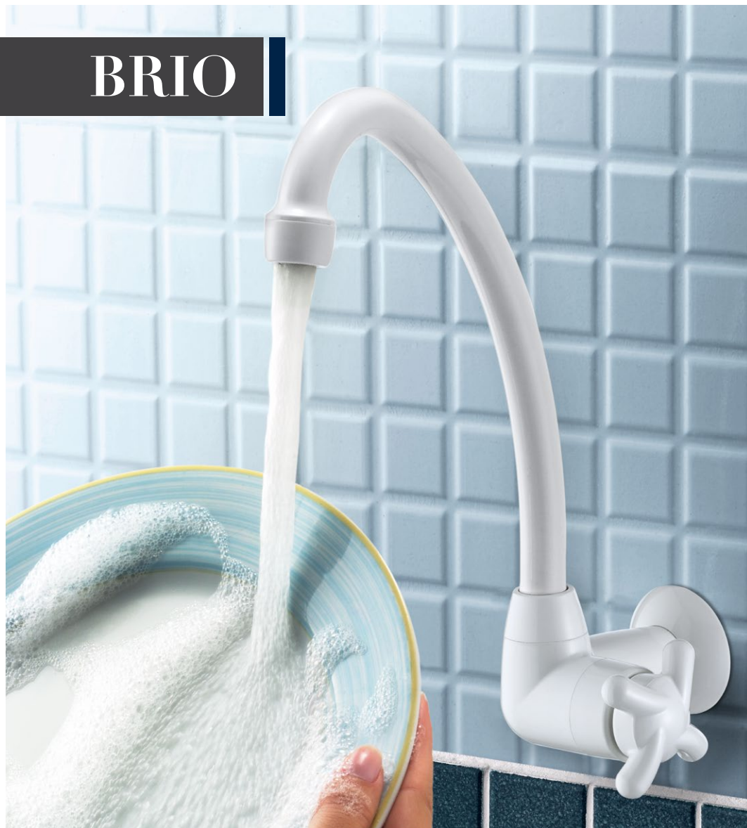
1167 F34 TORNEIRA COZINHA BICA MÓVEL DE MESA CROMADA | BRANCA