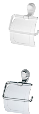
2020 F22 PAPELEIRA BRANCA | CROMADA