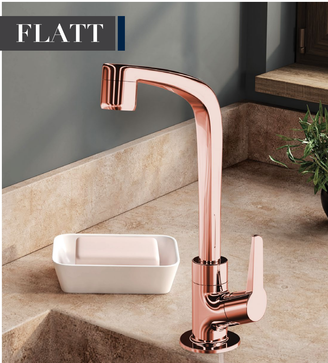
1167 F71 TORNEIRA COZINHA BICA MÓVEL DE MESA ROSE GOLD | CROMADA | BRANCA