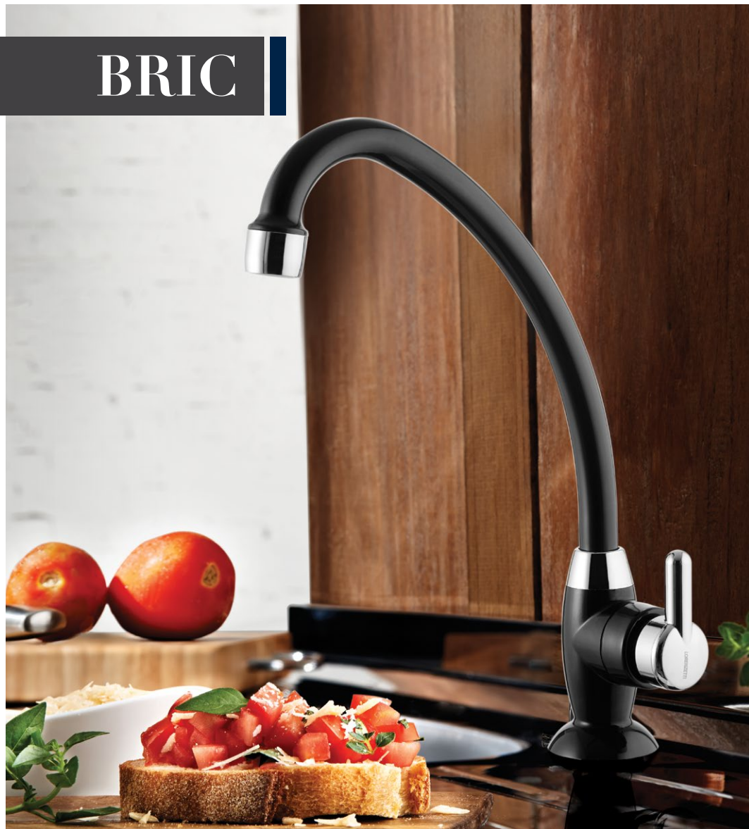
1167 F31 TORNEIRA COZINHA BICA MÓVEL DE MESA PRETA COM CROMADO | CROMADA | BRANCA